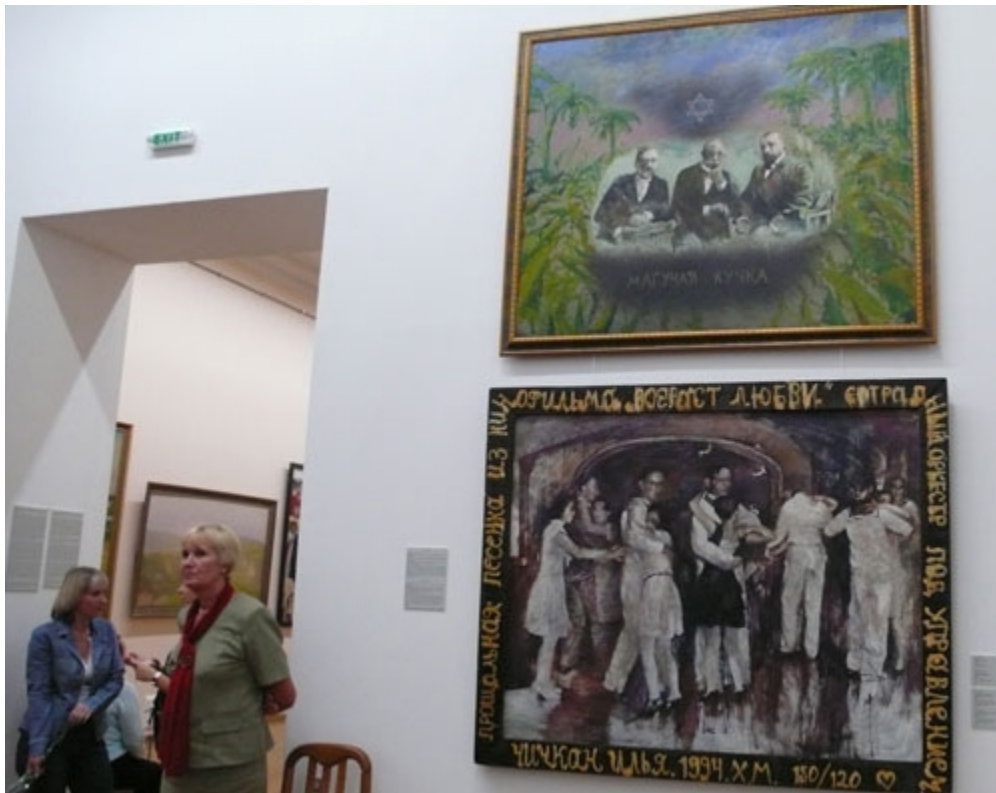
Илья Чичкан, сверху "Магическая кучка", 1992, из частной коллекции. Снизу - "Прощальная песенка "Возраст любви", 1994, из коллекции Музея современного искусства "Совиарт" Ассоциации галерей Украины

Последнее особенно болезненно напомнило о кризисе экспозиционного пространства. "Украинская Новая волна" явно не помещается в отведенные для выставки три зала, требуется как минимум в два раза больше.